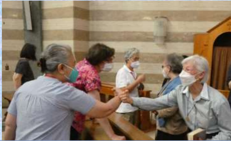
Meeting at mass with the sisters of the Rome community, until now confined because of the Covid

The generational groups presented their version of "The Gospel according to the Cenacle 2022". This was a step in continuing the discernment of the apostolic call of our Congregation for today. At the end of this moment, by groups of three, we met again, walking like the pilgrims of Emmaus, to share with each other the moments when our hearts were "on fire".