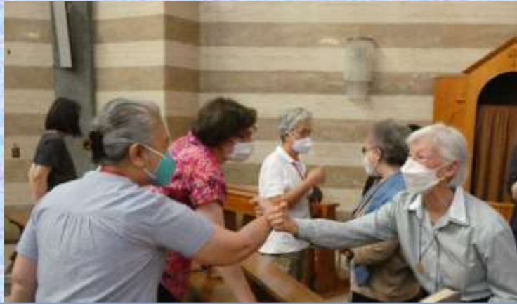
Retrouvailles des sœurs de la communauté de Rome, jusqu'à maintenant confinées à cause de la Covid

Les groupes générationnels ont présenté leur version de « L'Évangile selon le Cénacle 2022 ». Cela a été un pas pour poursuivre le discernement de l'appel apostolique de notre Congrégation pour aujourd'hui. Pour terminer ce moment nous nous sommes retrouvées à trois, à cheminer comme les pèlerins d'Emmaüs pour nous partager les moments où notre cœur était « tout brûlant ».